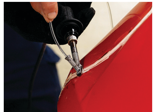
Utilice el soldador sin aire para nivelar soldaduras con aire caliente o para reparar parachoques y laterales de camiones de poliuretano termoestable (PUR) con la varilla de soldadura incluida.