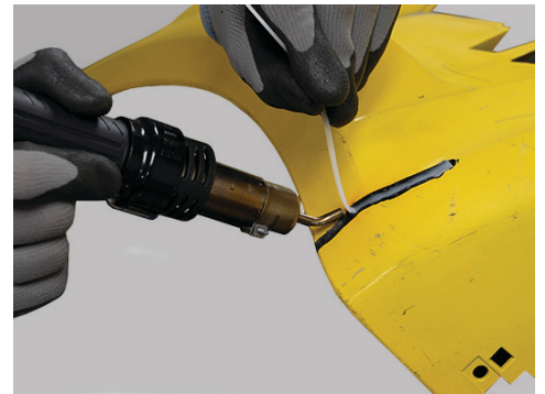
Utilice el soldador de aire caliente para realizar soldaduras rápidas y resistentes en termoplásticos con las varillas de cinta incluidas.